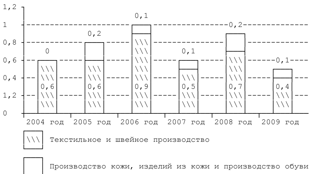
Рис. 1. Удельный вес выпуска продукции легкой промышленности в общем объеме продукции промышленности Удмуртской Республики в 2004 - 2009 годах

В 2009 году влияние мирового финансового кризиса негативно повлияло на работу промышленности Удмуртской Республики, в том числе и легкой промышленности. За период с января по декабрь 2009 года индекс физического объема производства составил 97,4 процента и 52,7 процента соответственно по видам экономической деятельности "текстильное и швейное производство" и "производство кожи, изделий из кожи и производство обуви".